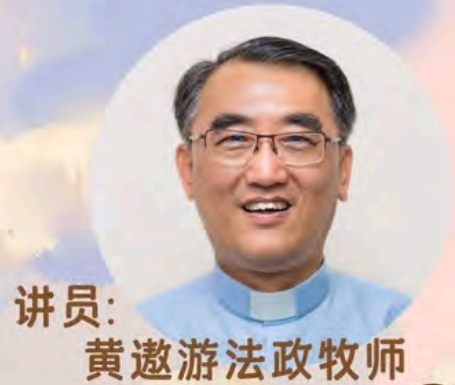
讲员: 黄邀游法政牧师

信息、灵修、活动、 节目 反思、工作坊 讨论将以小组团契模式进行 儿童节目适合K1-P6的孩子