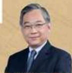
副总理 颜金勇 长老