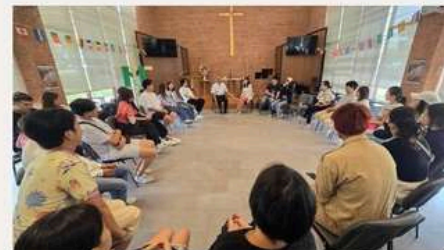
拉卡邦圣公会教会