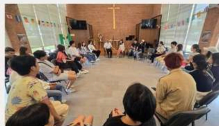
拉卡邦圣公会教会