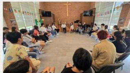
拉卡邦圣公会教会