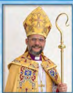
主题讲员： 东南亚教省大主教 暨新加坡教区主教 章剑文大主教(博士)