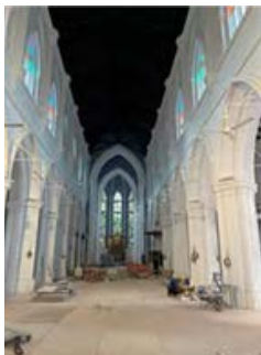
鹰架都已拆除，现正进行灯光和风扇的安装工作