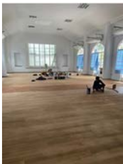
北边楼的大厅现正进行铺地砖工作