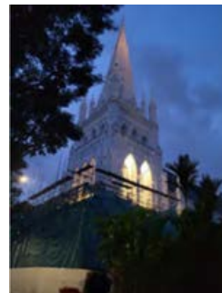
对钟楼的灯光进行测试