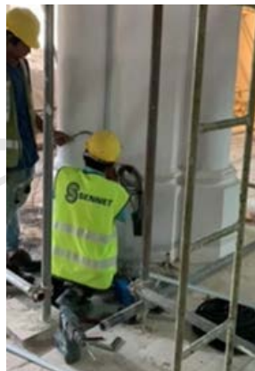
大堂区域的机电布线工程