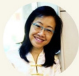
林秀娟会吏 圣约翰堂

十二小先知书中，何西阿书有着与众不同的故事背景：上帝要身为先知的何西阿去娶一位不守妇道的淫妇为妻。即使在今天的社会里这样的作法也是不被许多人所接受的。何西阿书所记载的会不会只是一个传说或虚构的故事？或者上帝真的命令何西阿娶淫妇为妻？到底何西阿书要传达的是什么样的信息？而这个信息与今天的我们又有什么关系？让我们打开何西阿书，一起探讨其中的真理，也一起学习信息中宝贵的功课。